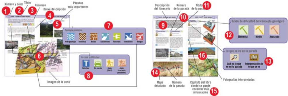
Figura 5. Estructura común para todos los itinerarios (ver significado de los números en el texto).

Al igual que la guía del Teide, al final se incluye un glosario de los términos usados, la bibliografía y un índice.