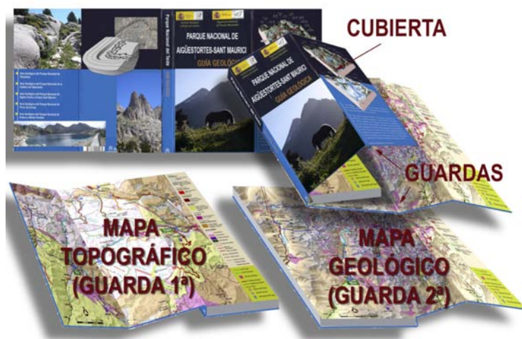
Figura 3. Las guardas de la cubierta se han aprovechado para presentar los mapas topográfico y geológico, con el fin de facilitar su consulta en todo momento.

un mapa en una hoja aparte que presenta por una cara el mapa geológico y por la otra cara el geomorfológico. La cubierta tiene dos guardas, que en la guía del Teide están en blanco. En esta guía se ha colocado un mapa topográfico con la situación de los itinerarios en la primera guarda y en la del final el mapa geológico simplificado. De esta manera, el lector, en cualquier momento, puede acceder fácilmente o bien al mapa topográfico para situarse o bien al geológico (Fig. 3).