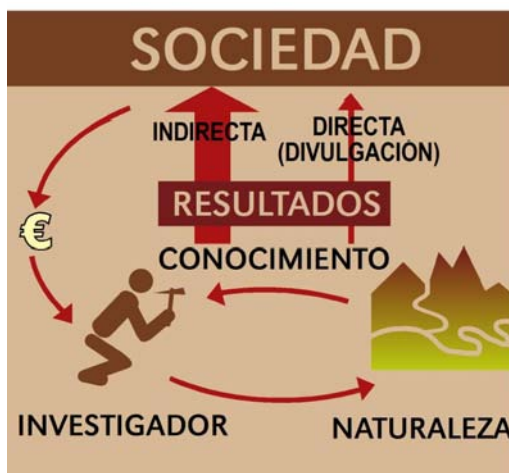
Figura 1. Los conocimientos del investigador, vuelven a la sociedad, en gran parte, de una manera poco perceptible.

Es de sobra conocido que el investigador realiza su trabajo a partir de unos ingresos provenientes de la sociedad. Este investigador estudia la naturaleza desde diversos puntos de vista y recibe un conocimiento determinado (Fig. 1). Este conocimiento vuelve (y tiene que ser devuelto) a la sociedad de una manera u otra. Generalmente, de una manera indirecta e imperceptible para la sociedad, ya que sus conocimientos a corto o largo plazo se utilizarán de una manera útil y práctica. Por ejemplo, el conocimiento de