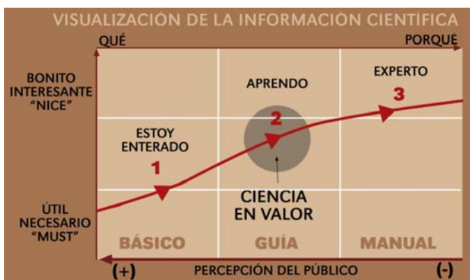
Figura 2. Esquema que refleja la visualización de la información científica según la percepción del público.